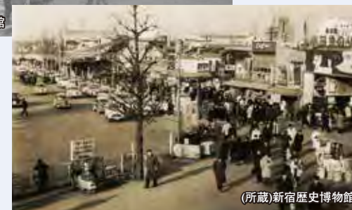
小さな商店が並んでいる駅前(国鉄・小田急とも)