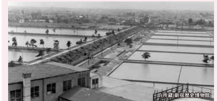
昭和40年3月廃止。その機能は東村山浄水場に移転