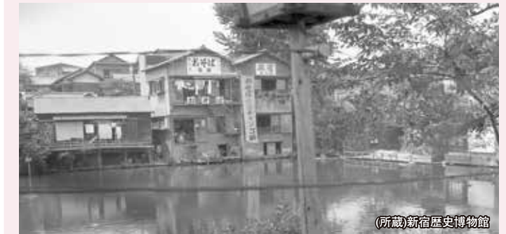
江戸時代以来の景勝地。昭和43年に埋立