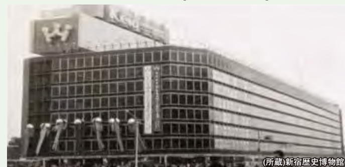
デパート建設に伴い、ホームが地下化され、平面交差が解消した。