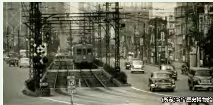
甲州街道を横切る京王線(昭和37年頃)