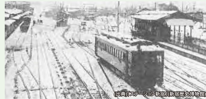
右に青梅口ホームが、中央奥に甲州口が見える。