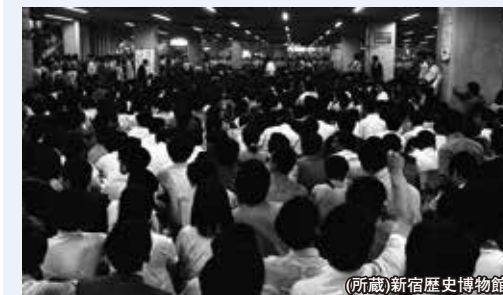
地下広場で開催されたベ平連の反戦フォーク集会