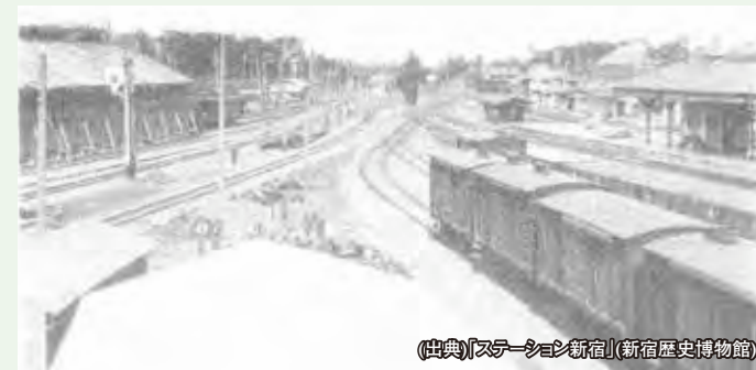
中央奥に甲武鉄道の青梅口ホームと跨線橋が見える。