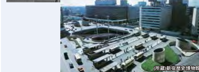
立体化後の西口広場(昭和42年) (所蔵)新宿歴史博物館