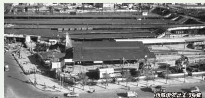
一番手前の短いホーム上屋の駅が京王新宿地上駅