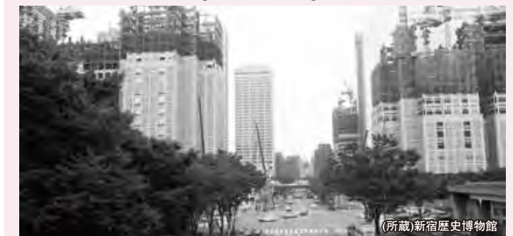
平成3年完成。48階243mは当時の日本一