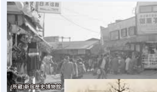
新宿駅西口(国鉄・昭和36年)