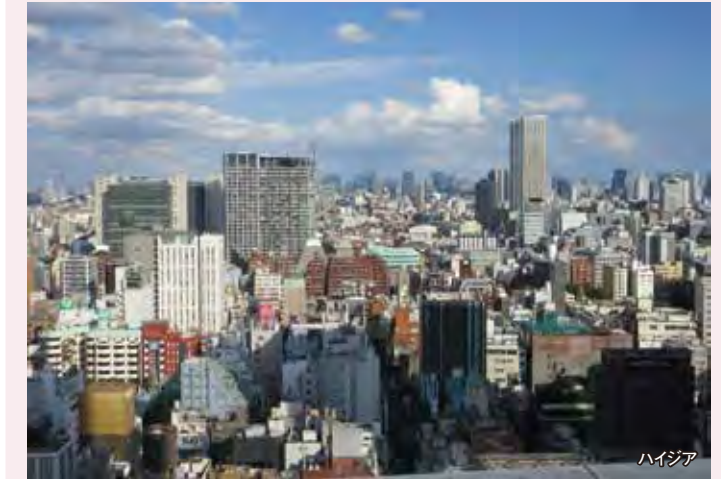
屋上から都心方向を望む