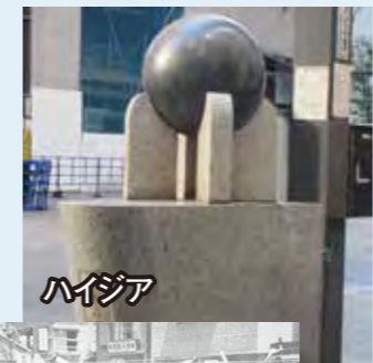
歌舞伎町建設記念碑