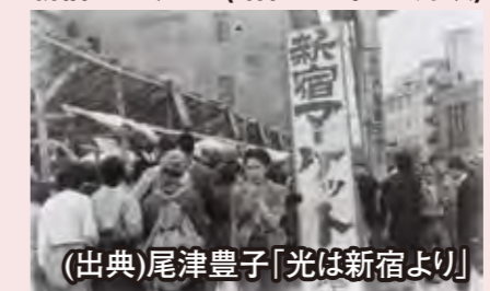
新宿マーケット(昭和20年10月頃)