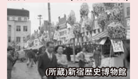
龍宮マーケット(昭和20年代)