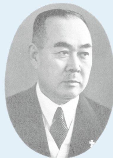
鈴木喜兵衛の肖像