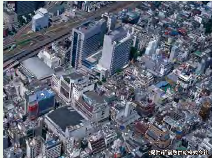
(提供)新宿熱供給株式会社