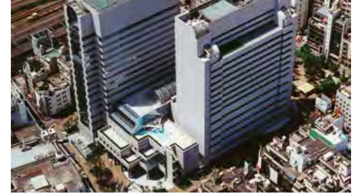
建替直後の大久保病院・ハイジア(平成5年)