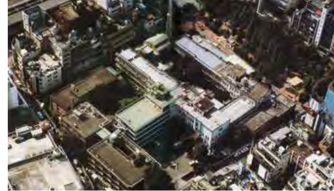
建替直前の大久保病院(昭和61年)